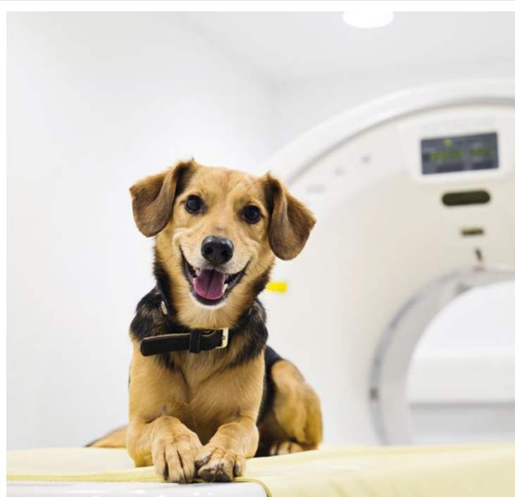
Einsatz beim Tier nicht geprüft