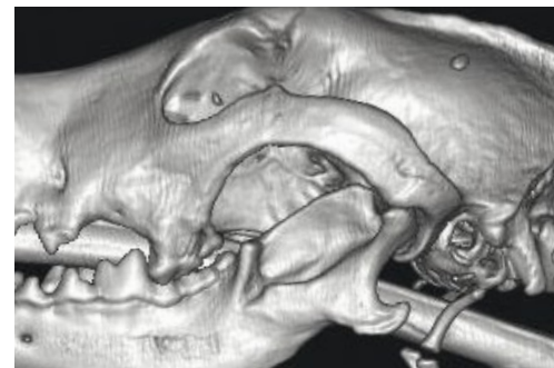
Nach OP: Partielle Amputation des Ramus Mandibulae