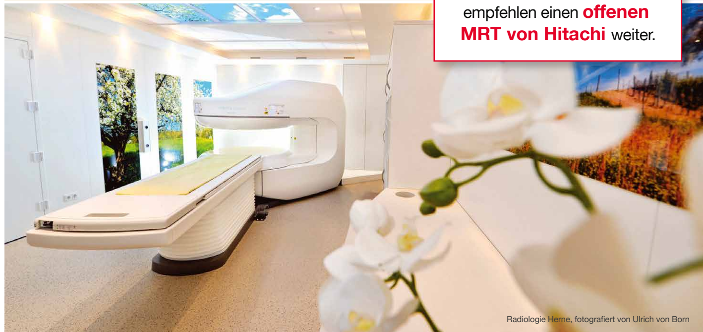
Radiologie Herne

95 %* der Patienten empfehlen einen offenen MRT von Hitachi weiter.